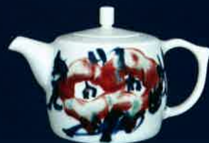
秦錫鎔・中国工芸美術大師 「青花釉裏紅急須『同錦簇花』」

(一財)日本中国文化交流協会、日中友好議員連盟、(公社)日中経済協会、(一社)日中協会 中国陶磁大師連盟、江西省工芸美術館