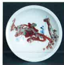
邱含「釉里紅小皿“林中遊戯”」