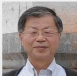
横浜国立大学名誉教授 一般社団法人 神奈川県日中友好協会 副会長