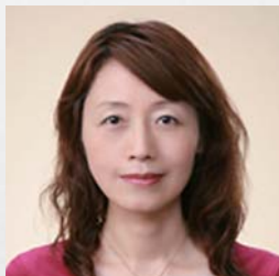
農林中金総合研究所 基礎研究部 主席研究員